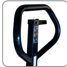
Ergonomisch handvat verzekert een relaxte grip. Kan voorzien worden van naam/afdeling.