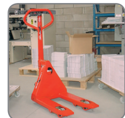
Verkrijgbaar in verschillende vorklengtes.

Wij bieden eveneens op maat gemaakte oplossingen. Vraag meer informatie, of bezoek www.logitrans.com