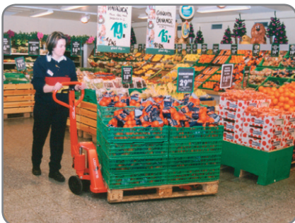
Aanpasbare vorkhoogte – geen problemen met lage en versleten paletten.

Roestvrij staal en explosievrije paletwagens eveneens verkrijgbaar.