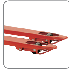
De beugels aan de vorkuiteinden garanderen een gemakkelijk inrijden en uitrijden van paletten.