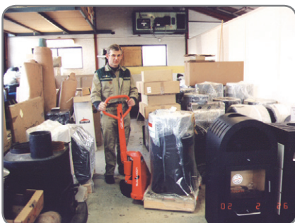
Gemakkelijk werken in gelijk welke enge ruimte verzekerd.