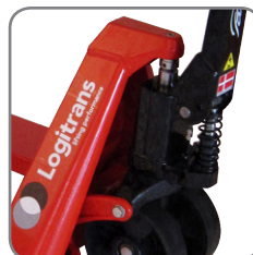
Permanente Quick Lift.