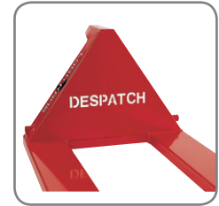
De bedrijfsnaam of logo kan uitgesneden worden uit de driehoek van de Panther.